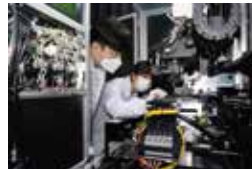
2021 : 세계최초 차세대 디스플레이 핵심기술 '마이크로 LED'