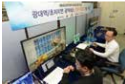
2019 : 25Gbps급 초각인터넷 기술 '틱톡(TIC-TOC)' 개발