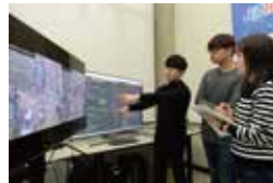
2020 : 시각지능 원천기술 플랫폼 '딥뷰(Deepview)' 개발