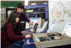
2015 : RoF 기반 모바일 프런트홀 기술 (High Five ESCoRT) 개발