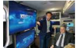
2018 : UHD 모바일방송 기술 개발