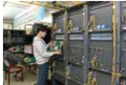
2016 : 광-회선-패킷 통합 스위칭 시스템 개발