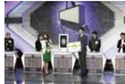
2017 : 고성능 언어지능 SW '엑소브레인(Exobrain)' 개발